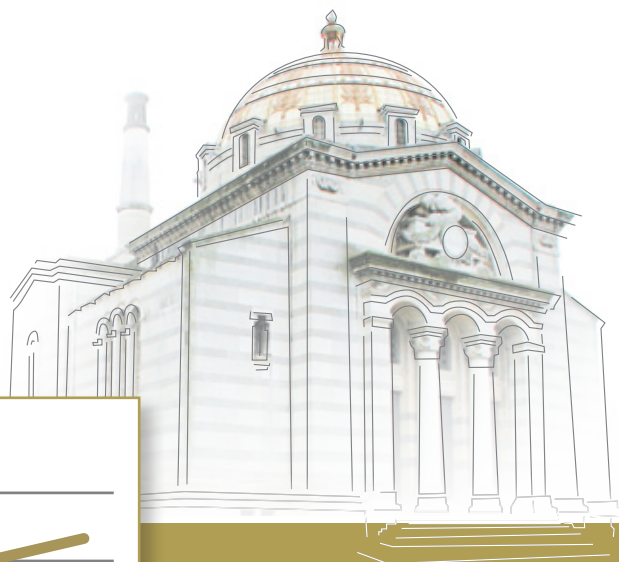
Une croissance qui se poursuit à Paris